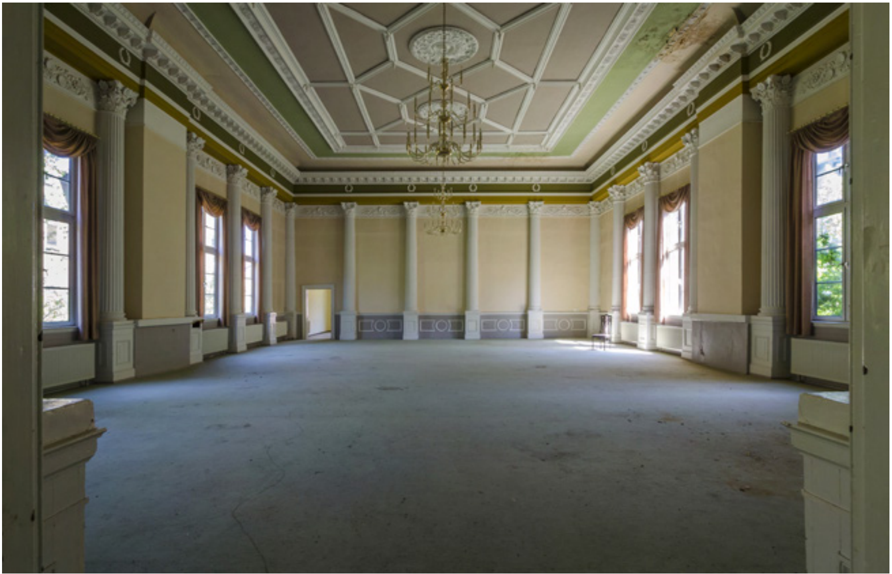
Erhabene Symmetrien im Festsaal eines ehemaligen Hotels.

Brennweite 10 mm :: Blende f/11 :: Belichtungszeit 1/4 s :: ISO 200