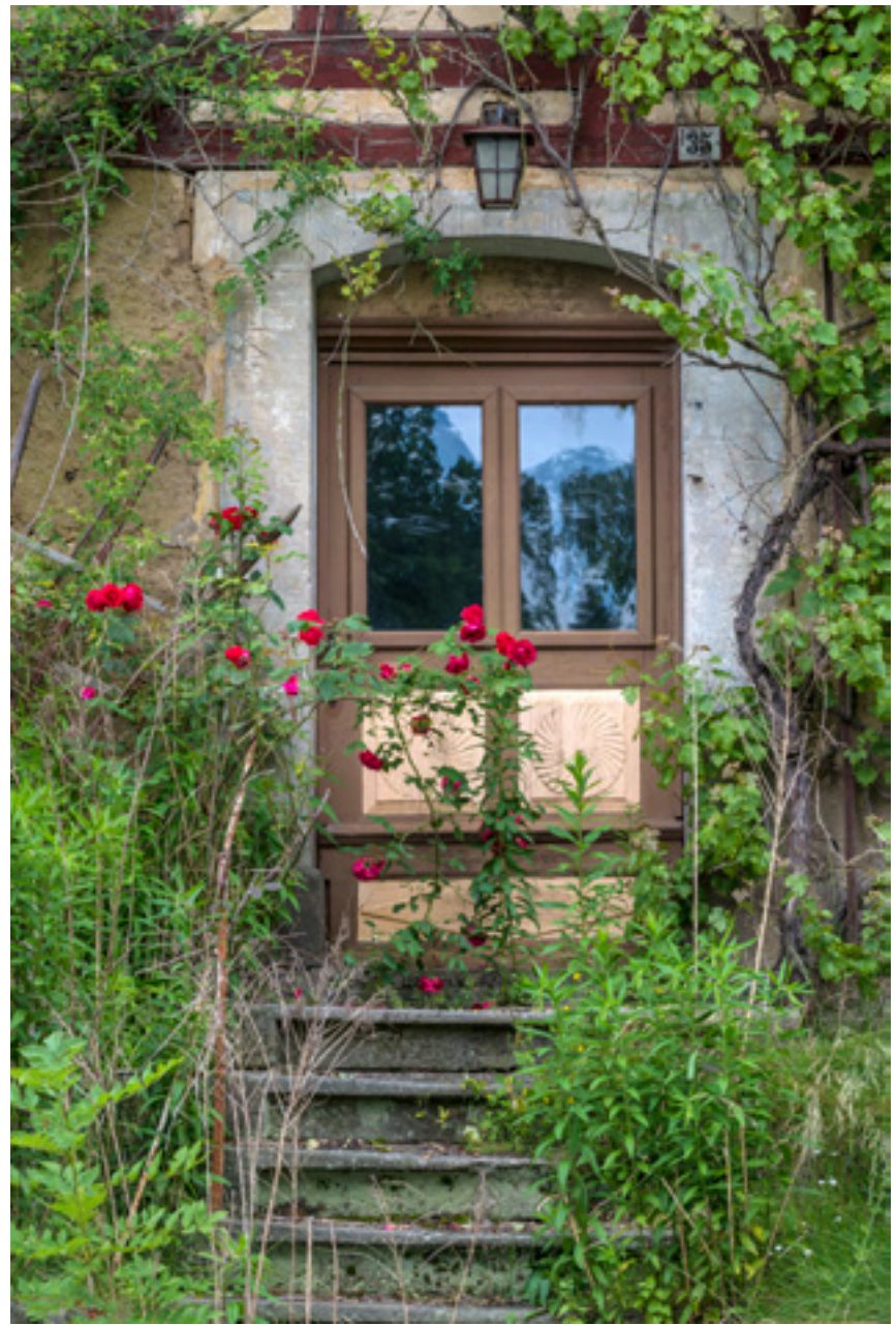
Verlockende Tür eines offensichtlich unbewohnten Fachwerkhäuses.

Brennweite 35 mm :: Blende f/7.1 :: Belichtungszeit 1/30 s :: ISO 400