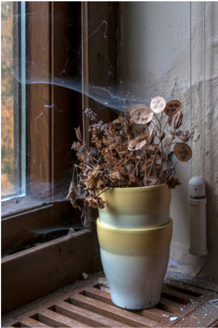
Morbider Vasenschmuck in einem verlassenem Hotel.

Brennweite 35 mm :: Blende f/7.1 :: Belichtungszeit 1/30 s :: ISO 400